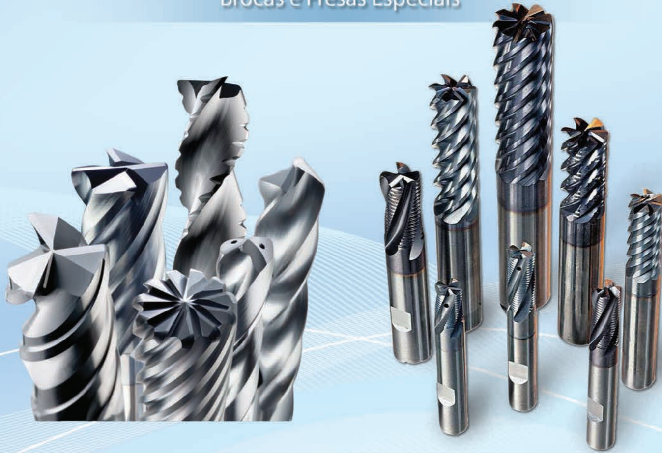
Brocas e Fresas Especiais