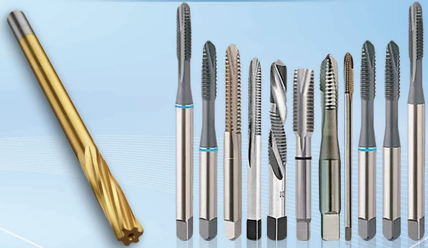
Alargadores e Machos em metal duro