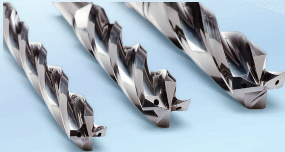
Broca Calibradora com Refrigeração Interna