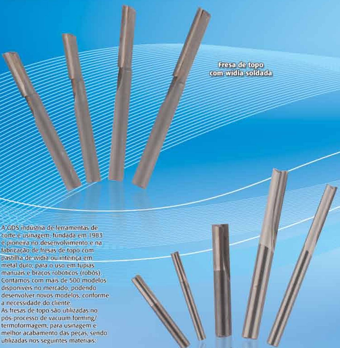
Fresa de topo com wídia soldada