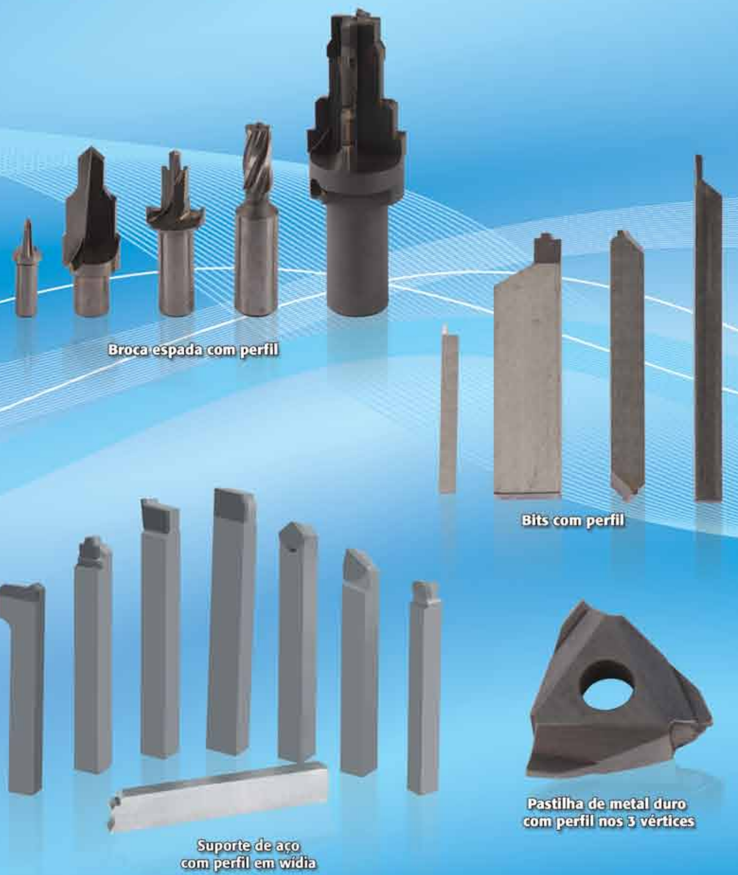
Broca espada com perfil